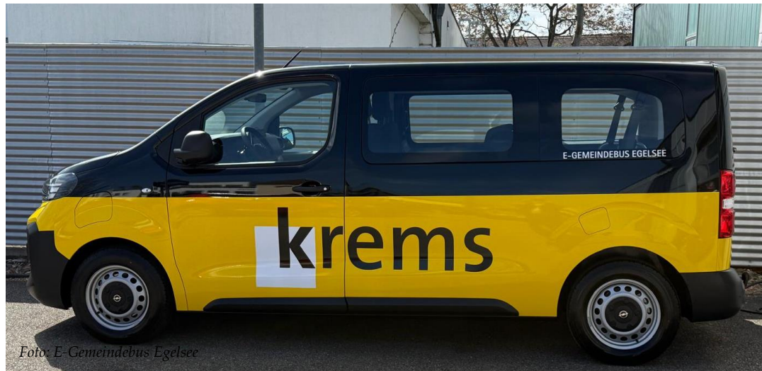
Foto: E-Gemeindebus Egelsee